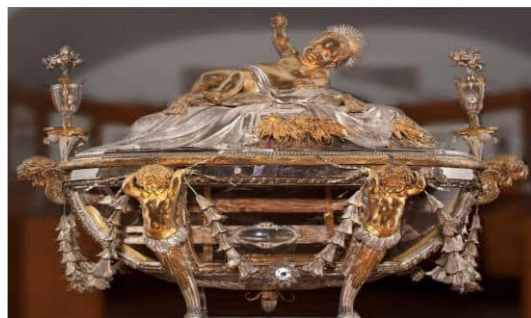
Hl. Wiege in der Basilika S. Maria Maggiore, Rom

Machen also auch wir uns auf zum Kind in der Krippe mit allen Sorgen, Mühen, Ängsten und Hoffnungen. Er ist der treue Gott, der die Seinen nicht verlässt. Er will in unser Herzenskripplein kommen und in uns leben.